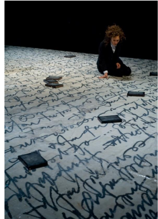
Visszaszületés (2009, rendező: Tompa Gábor)