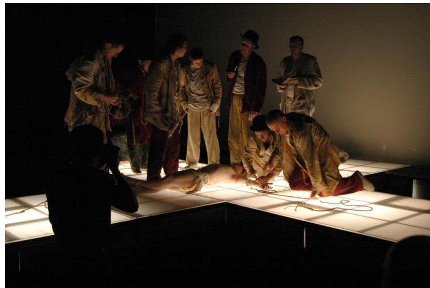
Tanítványok (2005, rendező: Tompa Gábor)