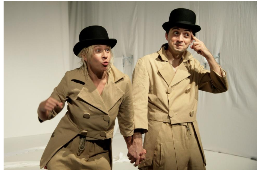
Temetés (2007, rendező: Bocsárdi László)