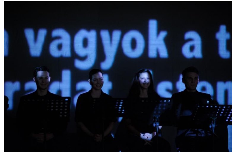
Én vagyok a te (2014, rendező: Visky András)