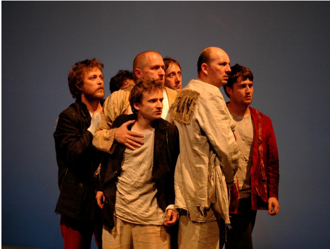
Tanítványok (2005, rendező: Tompa Gábor)

A fogság mint egyetemes élmény – nem pusztán egy politikai-történelmi paradigma, hanem egzisztenciális állapot, amely a történelmi-politikai viszonyokra is reflektál, az egyén „kis történetének” a nézőpontjából.