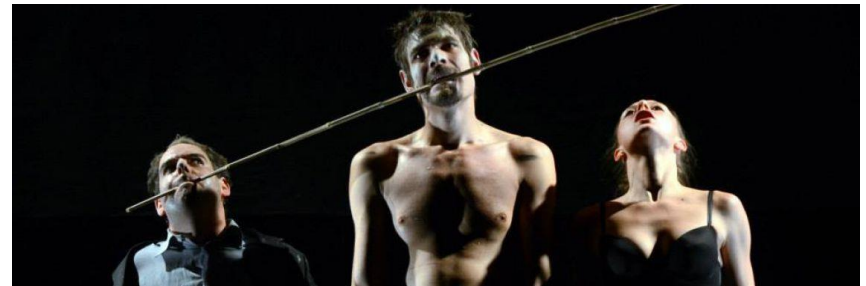
Rózsák (2014, rendező: Urbán András)