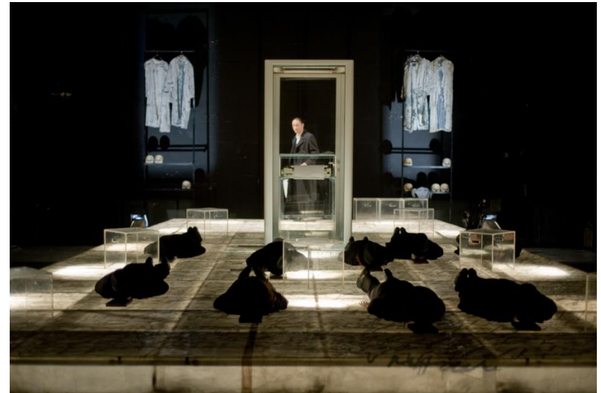
Hosszú péntek (2007, rendező: Tompa Gábor)