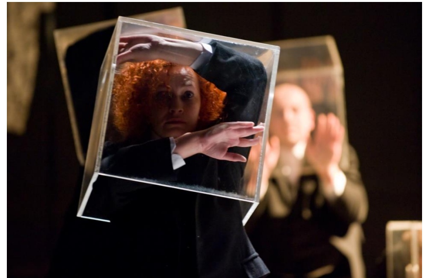
Visszaszületés (2009, rendező: Tompa Gábor)