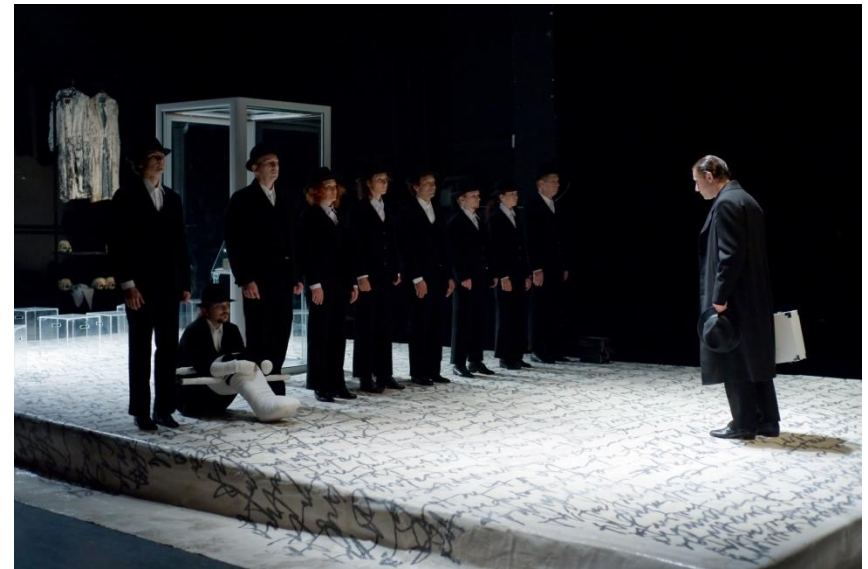
Hosszú péntek (2007, rendező: Tompa Gábor)