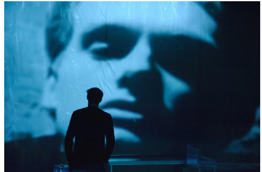
Caravaggio terminál (2014, rendező: Robert Woodruff)